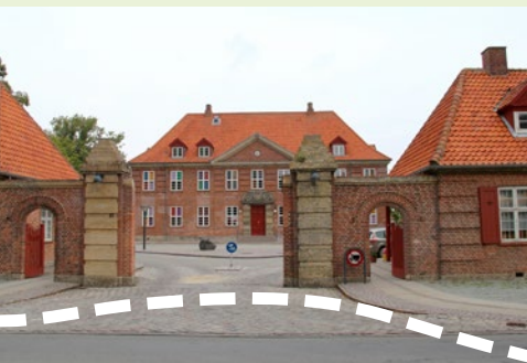
Hvidovre Kommune Børnenes og familiernes by