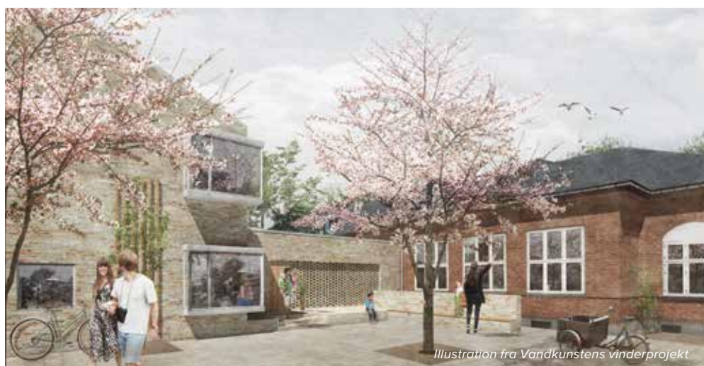
Illustration fra Vandkunstens vinderprojekt

En tredje besparelse på kultur- og fritidsområdet gælder museerne. Her er der ikke lagt op til, at prisen for at besøge fx Cirkus- eller Forstadsmuseet skal stige, men at besparelsen findes på museernes drift.