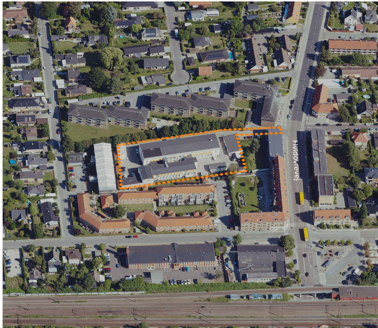
Luftfoto af Hvidovrevej 80.

For at kunne vedtage den nødvendige lokalplan vil det være nødvendigt, gennem et tillæg til Kommuneplan 2021, at ændre rammebestemmelserne for kommuneplanens område 1A1.